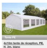
4x10m tente de réception, PE, H. 2m, blanc.

L'association s'est dotée d'un barnum aux dimensions : 4 x 8m pour ses manifestations. Il pourra être mis à disposition des adhérents en fonction de sa disponibilité.